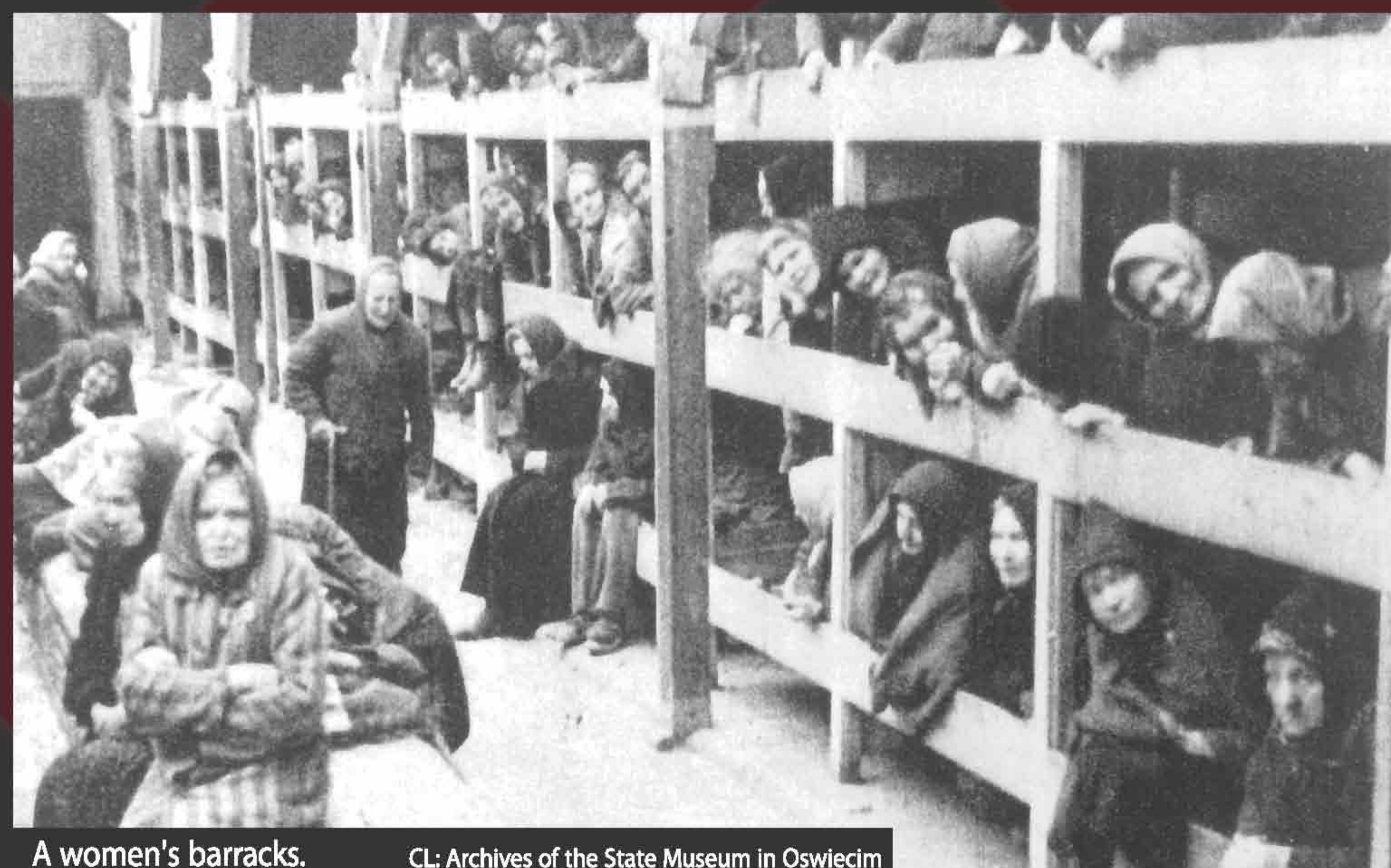
A women's barracks.

Living in filth and struggling against starvation, the people who could still work had the most likely chance for survival, a slim hope at best. An injury, often the result of the casual brutality of the guards, was synonymous with a death warrant.