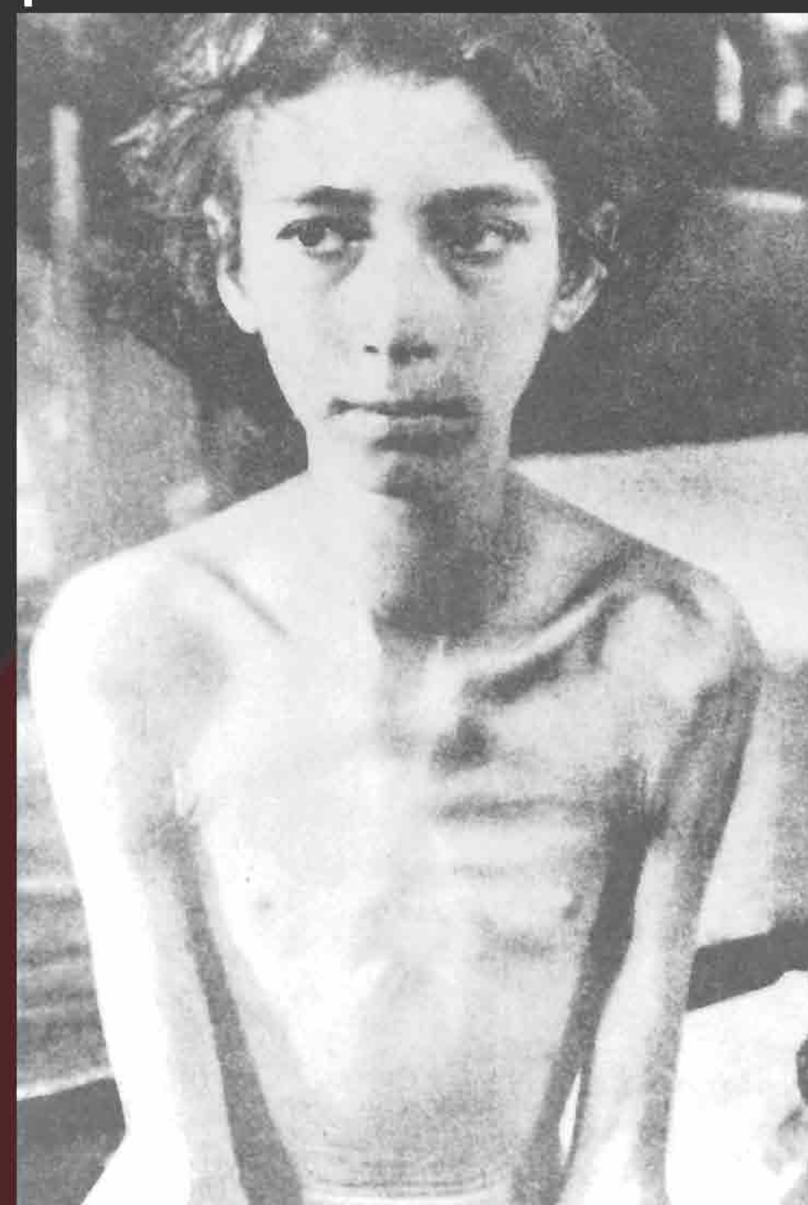
A ten-year-old female inmate after liberation, 1945.

Sadistic and brutal medical experiments were conducted at Auschwitz-Birkenau by Josef Mengele and other “physicians” like Johann Paul Kremer, Horst Schumann, Fritz Klein, and Carl Clauberg. Twins, dwarfs, pregnant women and other selected prisoners were used for gruesome “genetic” studies.