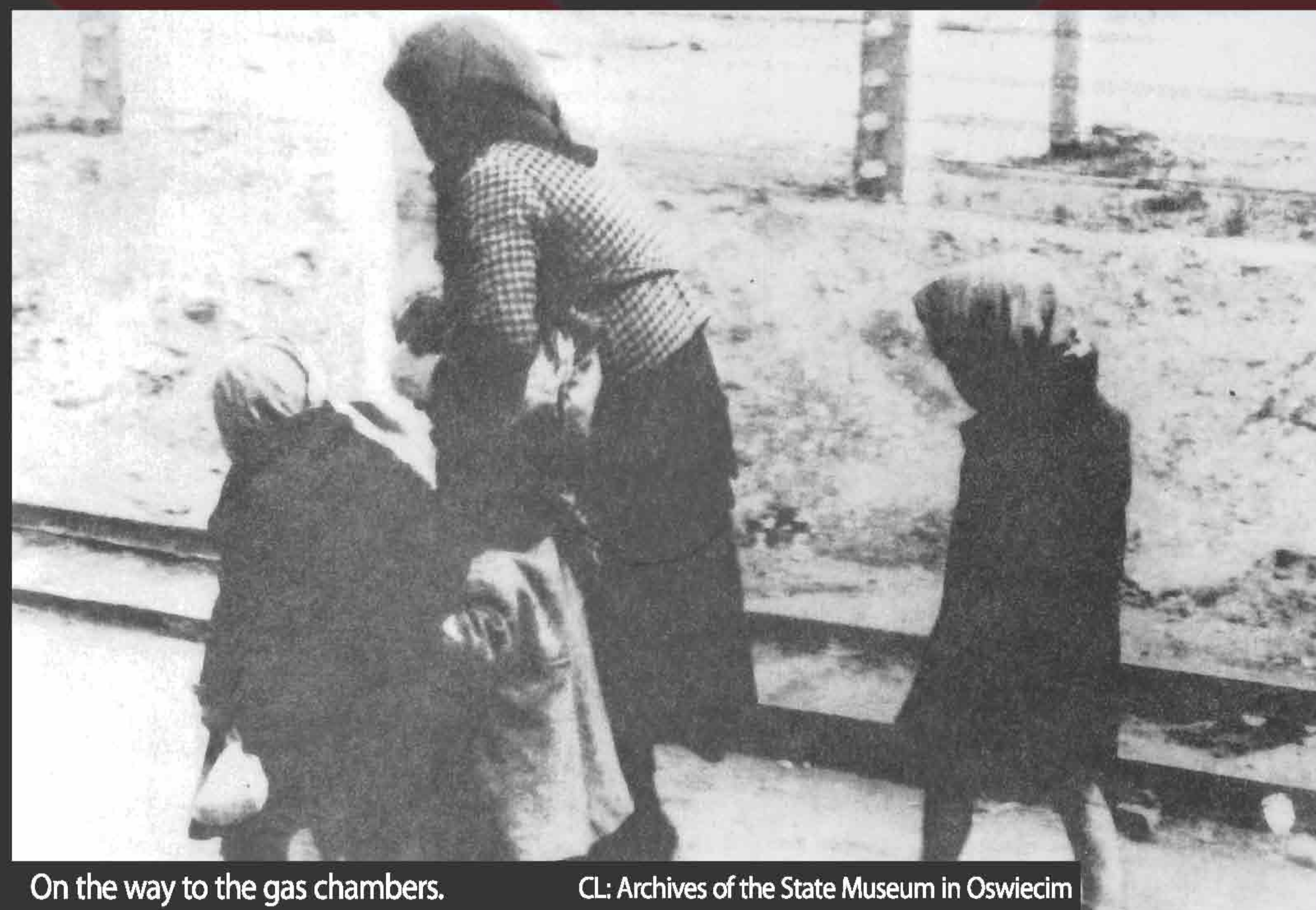
On the way to the gas chambers.