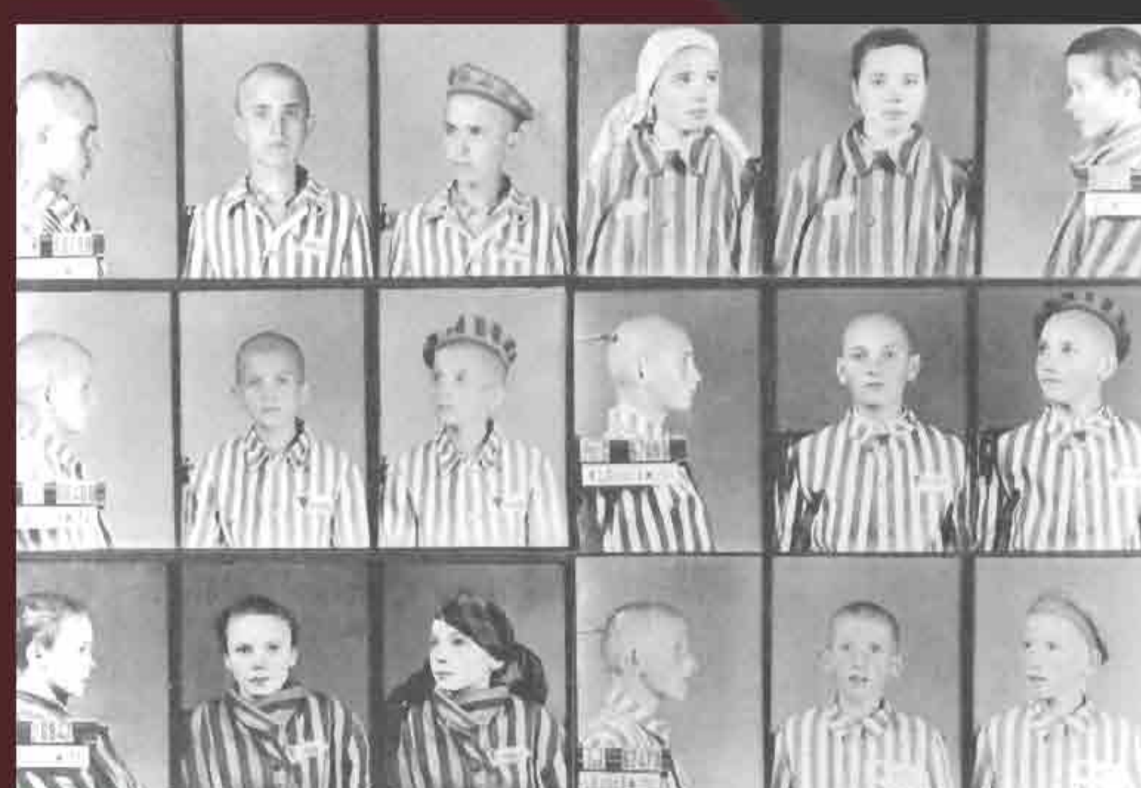
Polish children, numbered and photographed, upon arrival.

Living in filth and struggling against starvation, the people who could still work had the most likely chance for survival, a slim hope at best. An injury, often the result of the casual brutality of the guards, was synonymous with a death warrant.